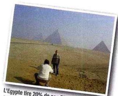
L'Égypte tire 20% de son PIB du tourisme et compte attirer 14 M de touristes par an d'ici 2011 (11 M en 2007, chiffres Ministère). Mais gare à l'environnement...